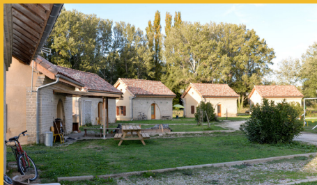
Pension de famille, Association Le Village Emmaüs, Cavailon (84)

Chez Emmaüs, nous pratiquons l'accueil digne et inconditionnel, sans distinction d'origine, de culture, de religion ou encore de genre. C'est une valeur fondamentale du Mouvement qui caractérise l'ensemble des dispositifs de solidarité développés au sein d'Emmaüs et qui constitue le socle de sociétés véritablement hospitalières.