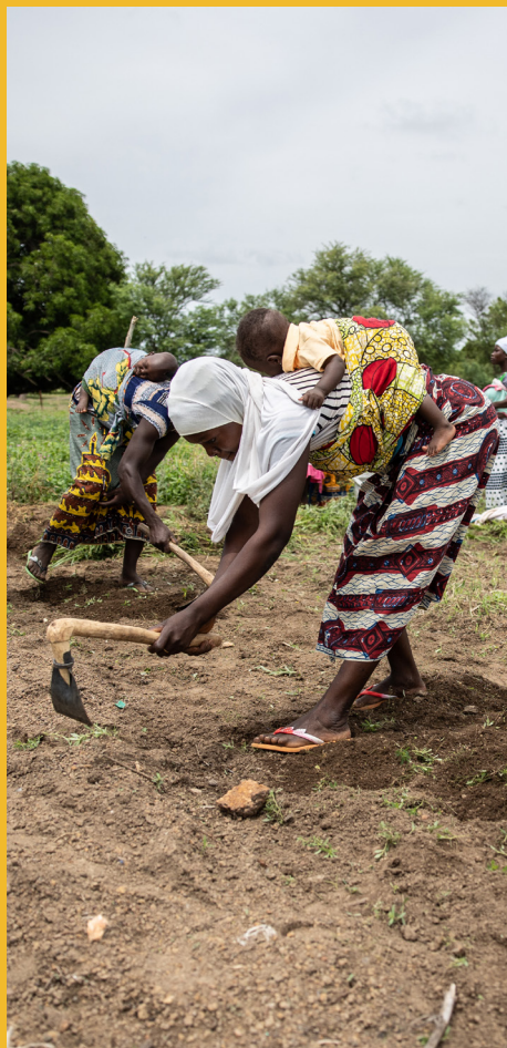
Pag-La-Yiri : Association de promotion des droits des femmes (Burkina Faso)

et un accompagnement à des personnes éloignées voire très éloignées de l'emploi. Emmaüs a également participé à la création de l'association « Territoires Zéro Chômeur de Longue Durée ». C'est en donnant la priorité aux acteurs et actrices de ces activités que nous pourrons mettre réellement l'économie au service de l'être humain et de son environnement.