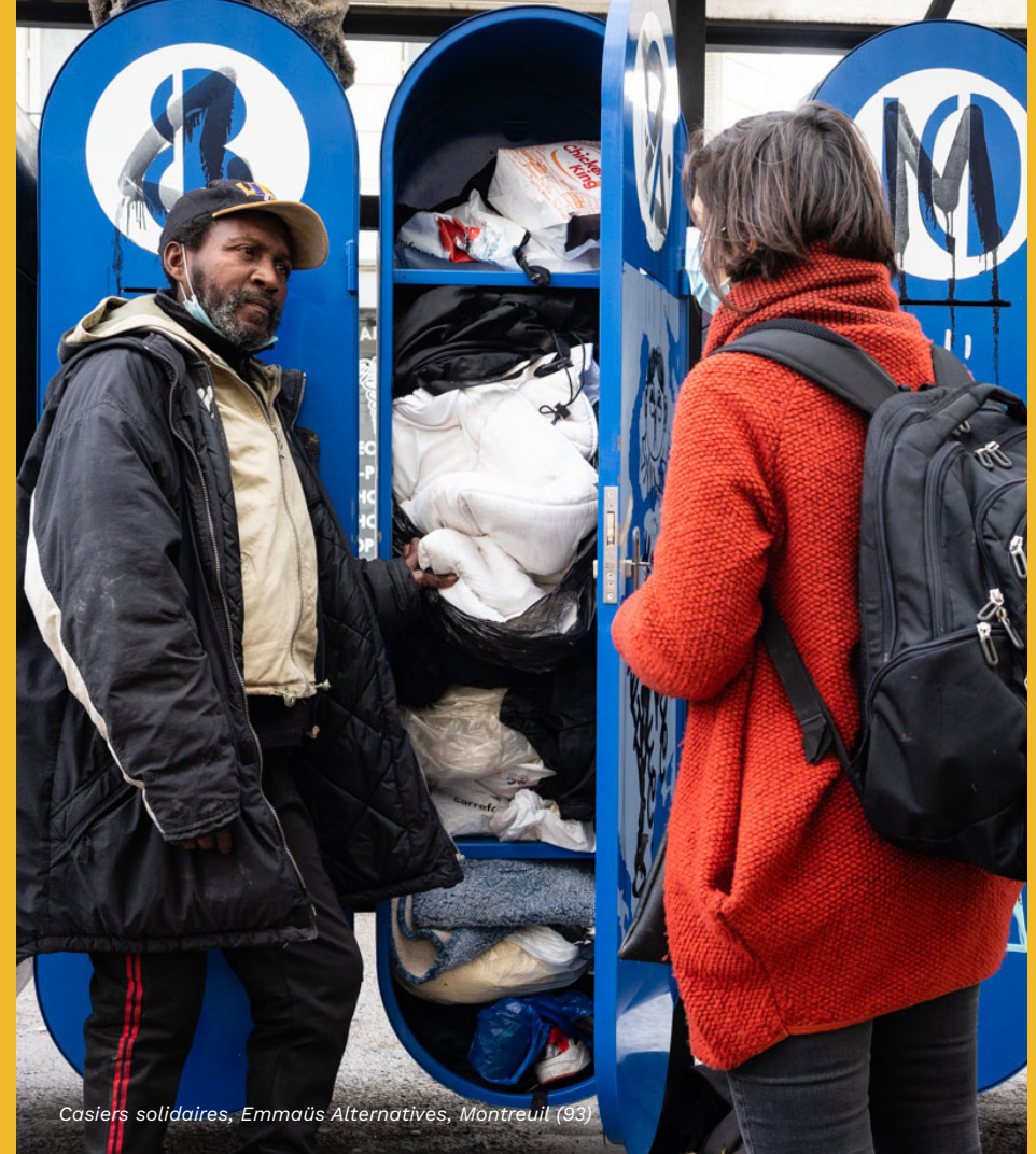
Casiers solidaires, Emmaüs Alternatives, Montreuil (93)

Aussi souvent que nécessaire, et chaque fois que nous sommes témoins d'injustices et d'inégalités, Emmaüs interpelle, sollicite, dérange les responsables politiques, les rappelle à leurs