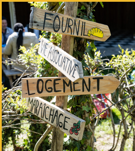
Association Tero Loko, Notre-Dame-de-l'Osier

Chez Emmaüs, les personnes accueillies ne sont pas simplement aidées mais deviennent actrices à part entière de la solidarité, tout en bénéficiant d'un accompagnement qui répond à leurs besoins. Ainsi, les conditions sont créées pour que chacune et chacun retrouve sa dignité et sa place dans la société, notamment en restaurant son estime de soi.