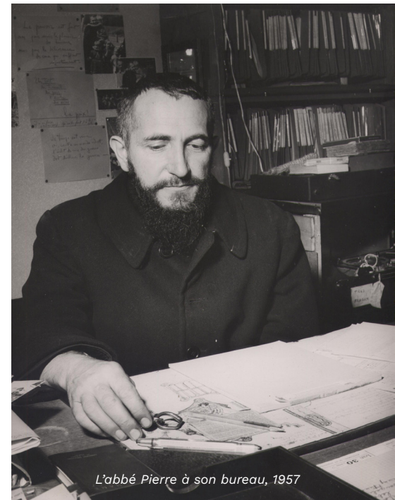
L'abbé Pierre à son bureau, 1957