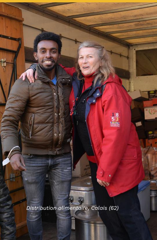
Distribution alimentaire, Calais (62)

Face au phénomène de mal-logement, Emmaüs s'est positionné dans le débat public pour la fin des expulsions sans solution de relogement, la garantie d'accès et de maintien dans le logement grâce à des lois à la hauteur des besoins dans le respect du principe du « Logement d'abord ». Aux côtés de nombreuses organisations, Emmaüs est présent dans tous les champs de l'hébergement et du logement pour défendre l'accueil inconditionnel et continu de toutes les personnes en détresse sociale, économique, physique ou psychique.