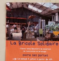
Portrait de l'abbé Pierre à la Bricolerie Solidaire - Emmaüs Terre (35)