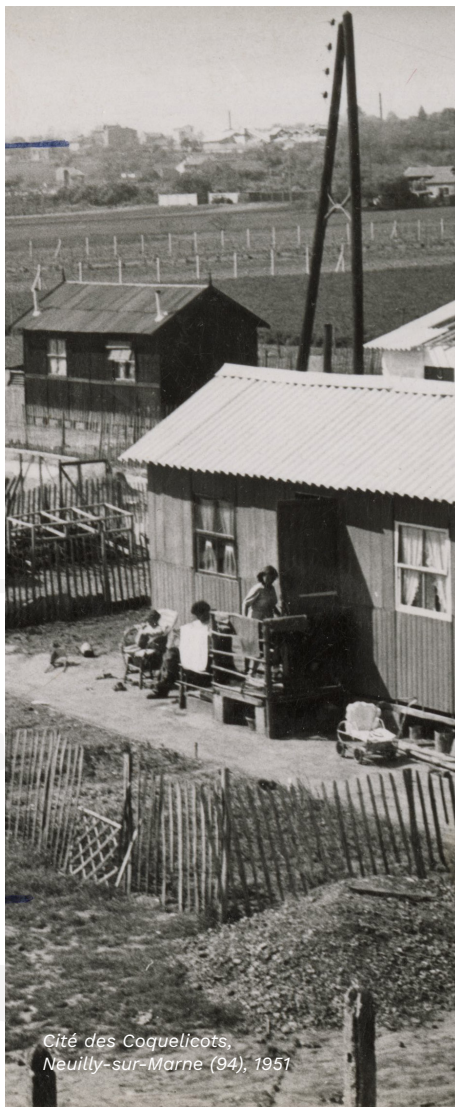
Cité des Coquelicots, Neuilly-sur-Marne (94), 1951

de Paris pour distribuer un peu de nourriture et des vêtements aux personnes qui dorment à la rue. Le 29 janvier, l'abbé Pierre crée le premier « centre fraternel de dépannage », accueil de nuit installé sous une tente, sur un terrain vague en plein Paris.