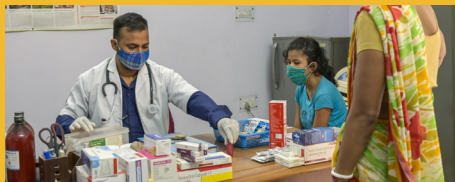
Centre médical de l'association Emmaüs Tara Project - Inde