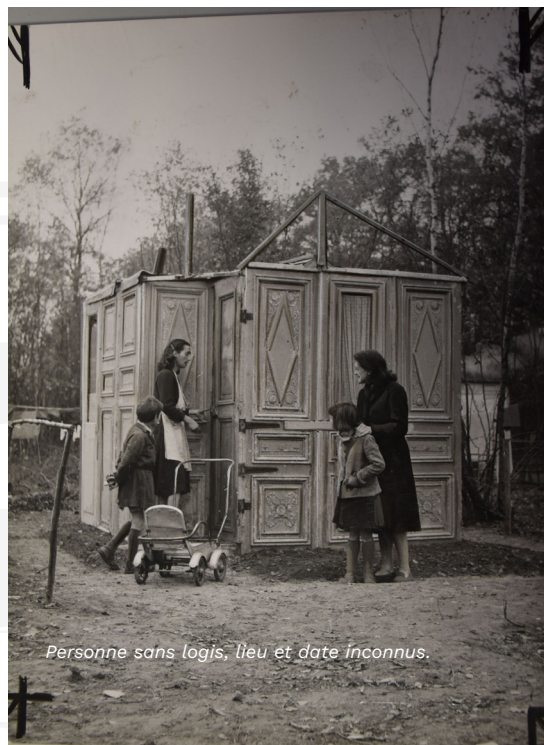
Personne sans logis, lieu et date inconnus.

Aujourd'hui encore, nous avons le pouvoir d'agir face aux situations qui nous indignent !