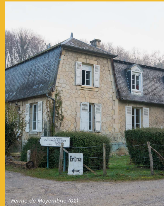
Ferme de Moyembrie (02)