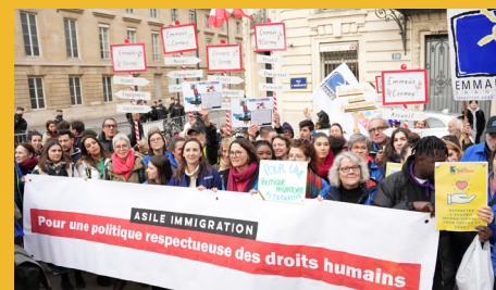
Rassemblement inter-associatif contre le projet de loi Immigration - Décembre 2023 (Paris)

L'indignité de l'accueil qui est aujourd'hui réservé aux personnes exilées, notamment en Europe, a poussé Emmaüs à réclamer depuis de nombreuses années d'autres politiques migratoires, basées sur le respect effectif des droits humains et un dialogue raisonné associant personnes exilées, associations et pouvoirs publics. Face à l'insuffisance de la réponse publique, de nombreux groupes Emmaüs ont mêlé l'interpellation à l'action, en proposant aux personnes exilées un accueil et un accompagnement dignes.